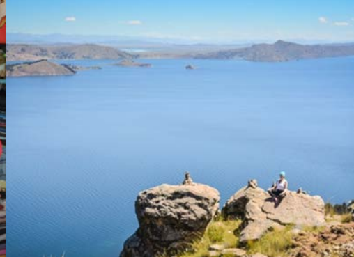
Ausflüge zu Perus Hochebenen mit den typischen Herden von Lamas und Alpakas. Mit Höhen über 4.500 m.